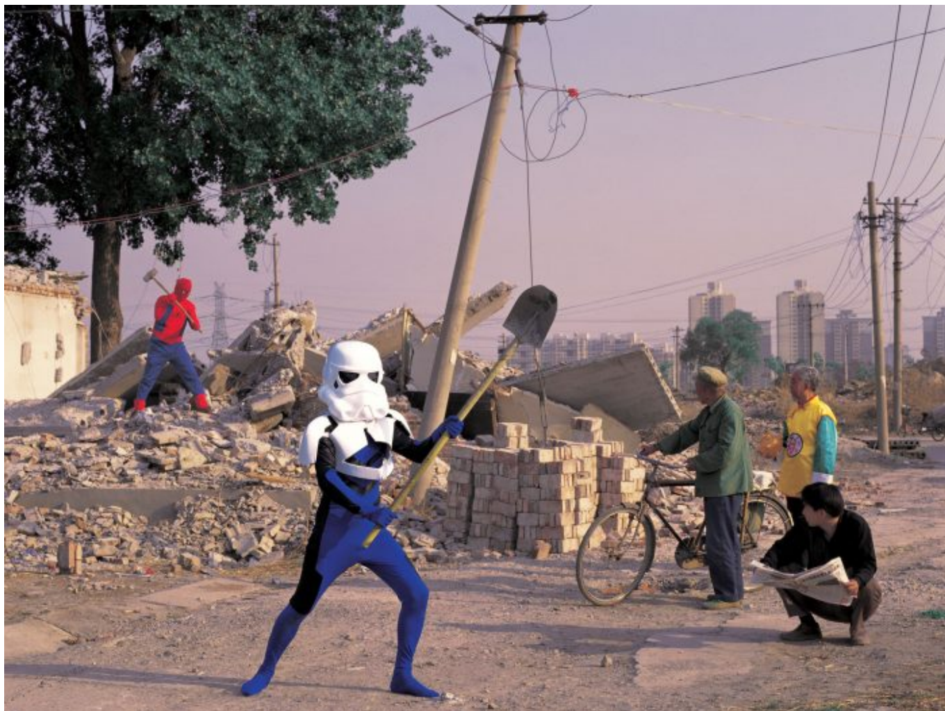
Cao Fei, Housebreaker, 2004

La guerra de Estados Unidos contra Irak en 2003 comenzó en un momento en que los Estados Unidos parecía ser inexpugnable, el país más poderoso del mundo. El atolladero en Afganistán e Irak, así como la crisis económica general de 2007-08 ha debilitado el poder de Estados Unidos. El ascenso de Donald Trump a la presidencia de ese país y su ataque a las instituciones multilaterales lo ha puesto más aún en un curso de aislamiento o al menos ha amortiguado lo que parecía ser su poder abrumador sobre los asuntos mundiales.