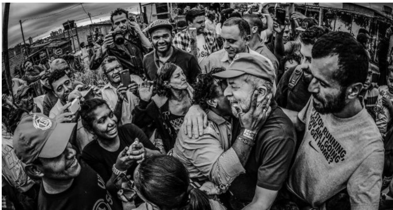
Lula (2018).