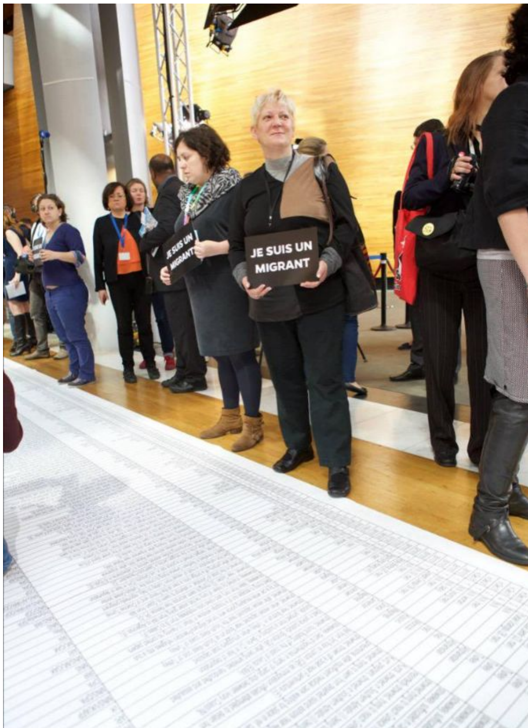
Parlement européen, Strasbourg, 2015.

Le Président des Etats-Unis est plus le Président de mon pays que le Président de mon pays : la huitième lettre d'information (2019).