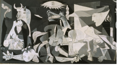
Pablo Picasso, Guernica, 1937

Chers amis, chères amies, Substitutions de l'impérialisme , l'histoire de l'industrie sociale .