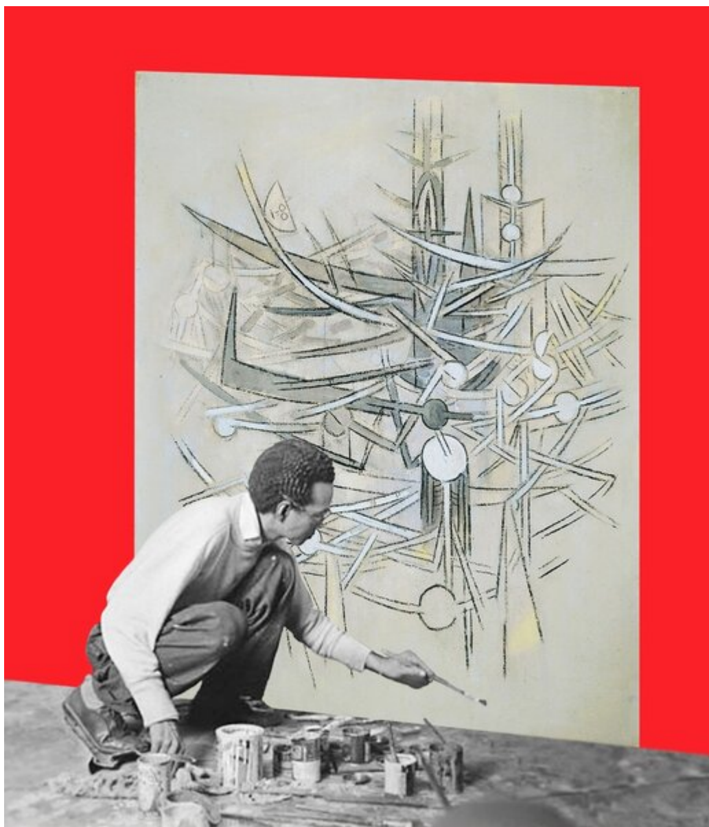
La Barrière or The Obstacle / Препятствие, 1964. Wifredo Lam / Вифредо Лам.

С 1959 Куба сталкивается с суровой блокадой — бессердечным оружием в руках правительства Соединенных Штатов Америки. Для Вашингтона было просто не допустимо, что маленький остров всего в двухстах километрах от Соединенных Штатов будет экспериментировать с социализмом. В прошлом году, исполнительный секретарь Экономической комиссии ООН по Латинской Америке (CEPAL), Алисия Барсена, сказала в Гаване (Куба), что блокада Соединенных Штатов стоила Кубе $130 миллиардов долларов за последние шесть десятилетий — сумма денег необходимая, чтобы построить и поддерживать в исправности новую космическую станцию. Это