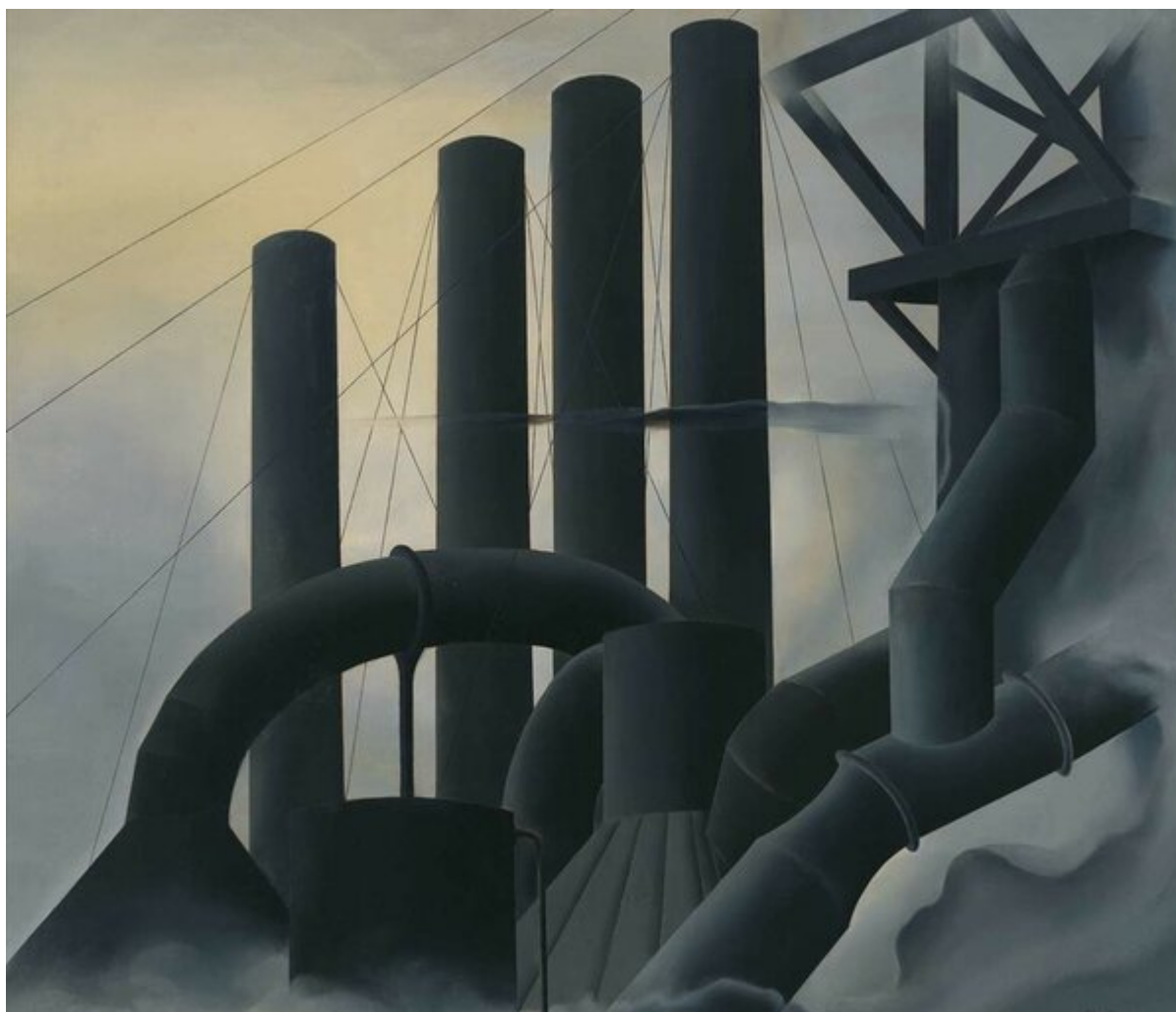
Pittsburg / Питтсбург, 1927. Elsie Driggs / Элси Дриггс.

Эта непристойность только увеличивается, если принять во внимание подход современного мирового порядка к бедности. Всемирный банк определяет термины для языка борьбы с бедностью. Он предлагает три следующих решения: продвижение частной собственности, использование государственных средств с целью строительства больших проектов инфраструктуры и продвижение высоких темпов роста.