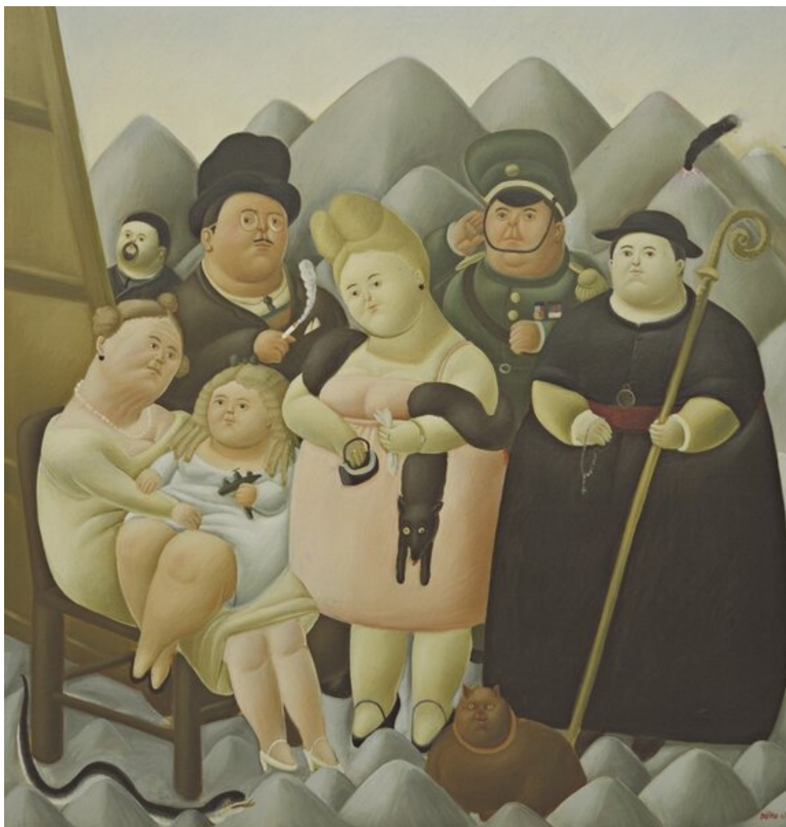
The Presidential Family / Семья президента, 1967. Fernando Botero / Фернандо Ботеро.

Революции — это не поездка на поезде, а скорее человечество, которое хватается за аварийные тормоза: двадцать девятое ПИСЬМО