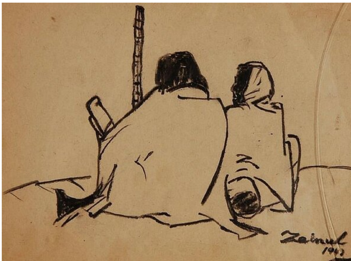
Famine Sketches / Этюды голода, 1943. Zainul Abedin / Зейнул Абедин.

Революции — это не поездка на поезде, а скорее человечество, которое хватается за аварийные тормоза: двадцать девятое ПИСЬМО