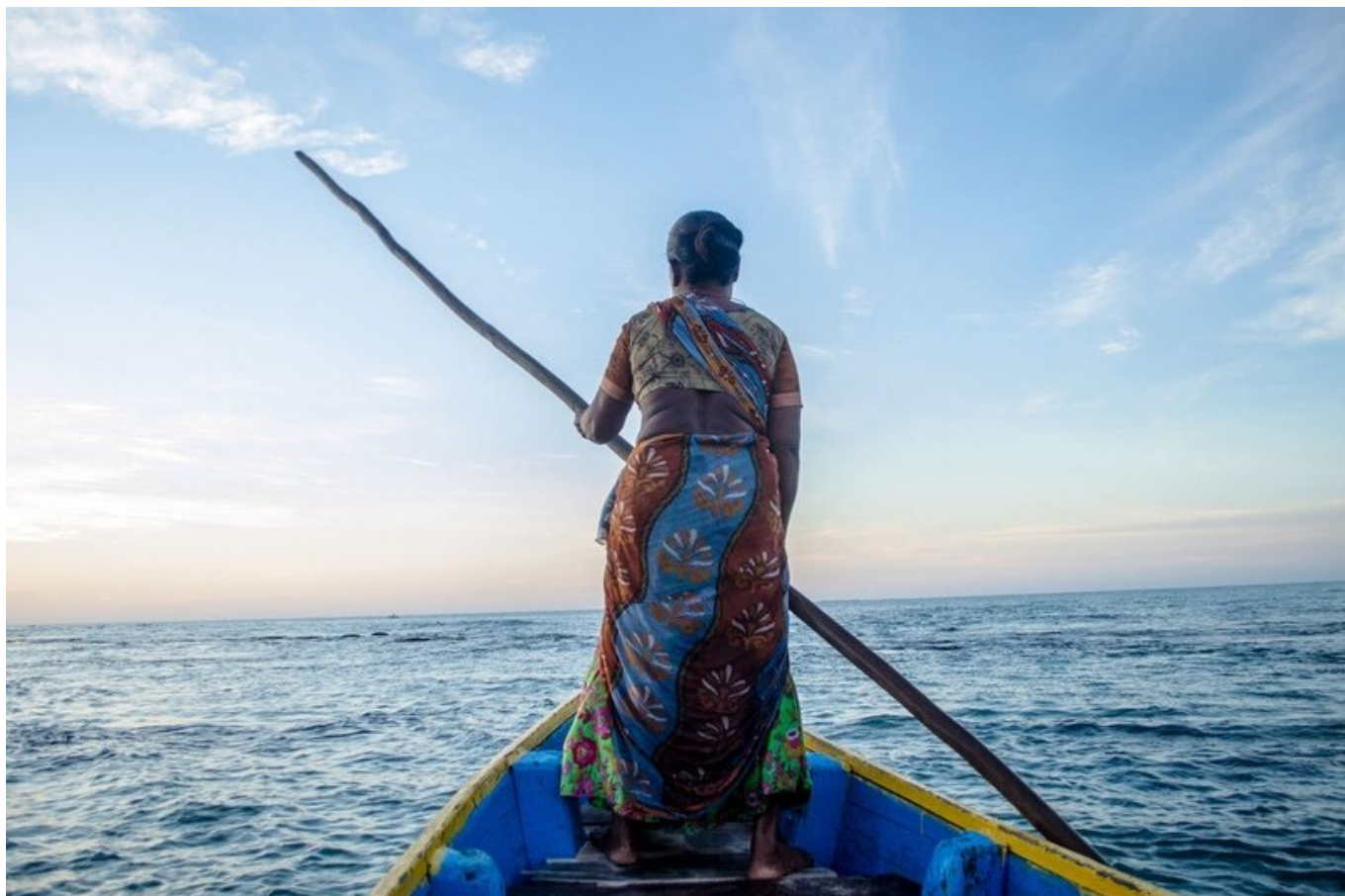
Выход лодки в море. М. Палани Кумар, 2019. М. Palani Kumar / М. Палани Кумар.

Амазонки (которому посвящено наше досье номер 14 ) и зададутся вопросом: Грязь, Огонь и Нефть: Как мы пришли к этому?