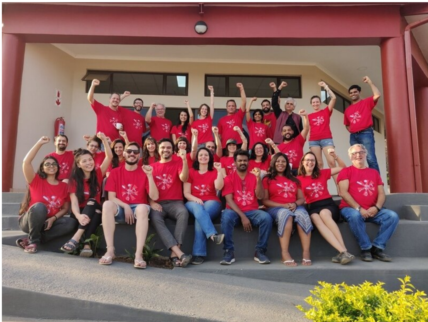
Tricontinental: Институт социальных исследований, Южная Африка, октябрь 2019.

English Español Português Français Deutsch