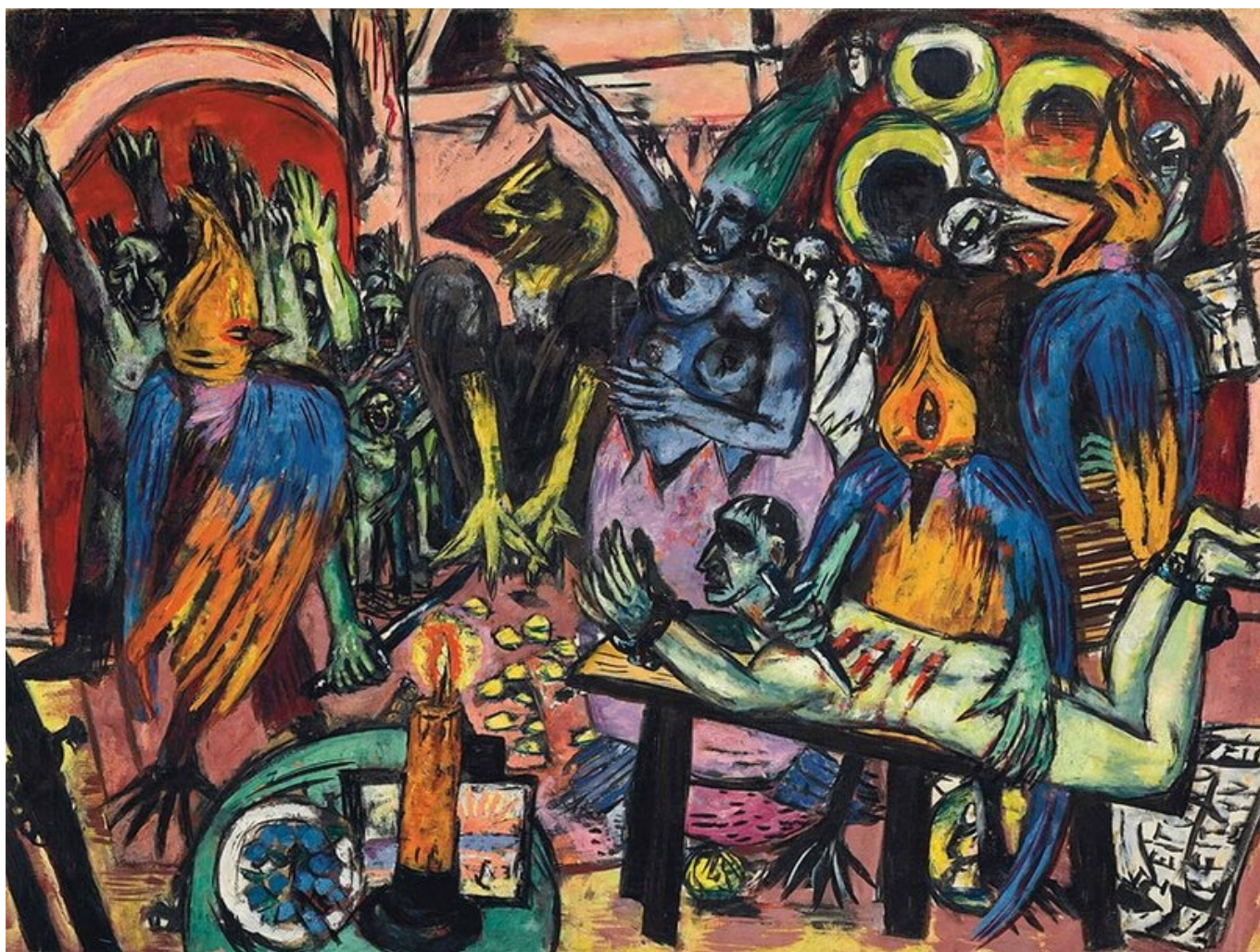
Hölle der Vögel / Ад птиц, 1937-38.