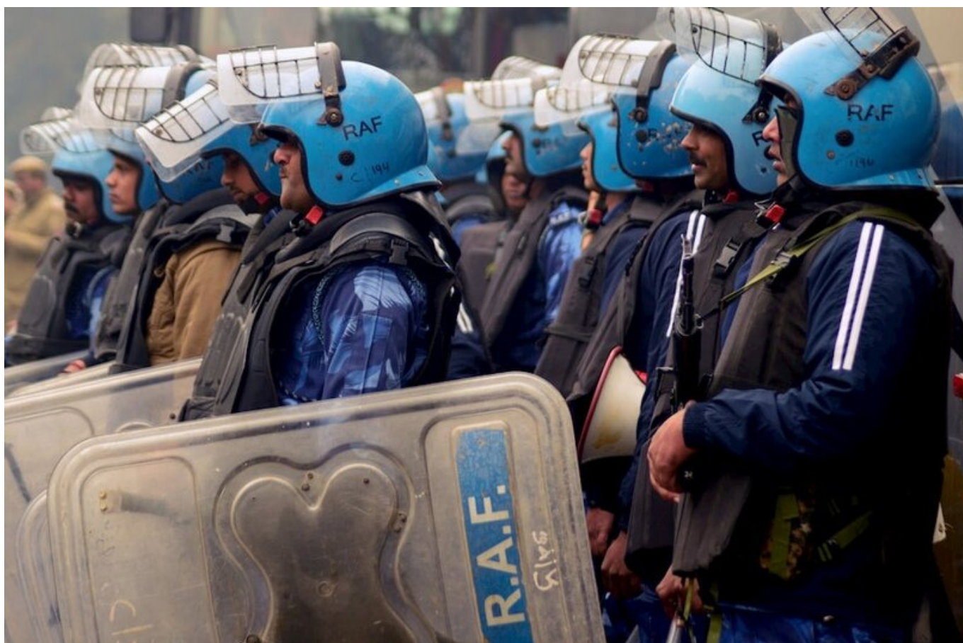
Силы Быстрого Реагирования, Дели, 19 декабря 2019.

защищающих права и культуру меньшинств. Эти законы и регулирования были необходимы для расширения демократии в обществе. Но демократия крайне правых основана не на их защите, а на их разрушении. Они стремятся натравить большинство против меньшинства, чтобы привлечь массы на свою сторону, но не позволить классам внутри их развивать свою собственную политику. У крайне правых нет преданности традициям и правилам либеральной демократии. Они будут использовать институты до тех пор, пока они полезны, отравляя культуру политического либерализма, которая имела серьезные ограничения, но которая, по крайней мере, предоставляла пространство для политической борьбы. Это пространство сейчас сужается, поскольку всё более ожесточенная защита крайне правых становится в порядке вещей.