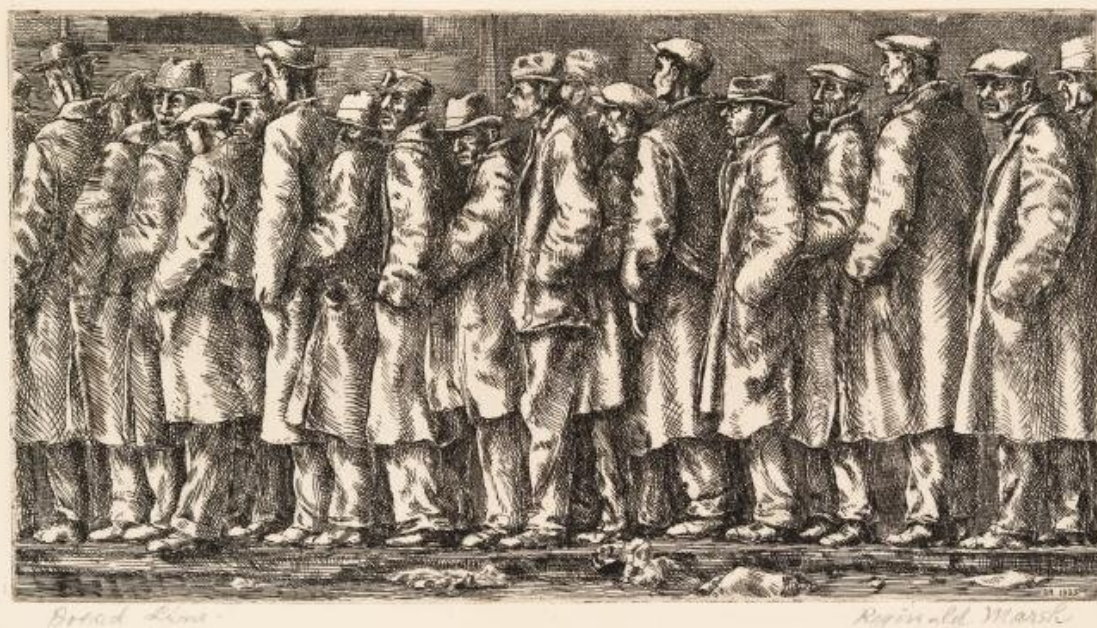
Bread Line - No One Has Starved / Очередь за хлебом - Никто не голодал, 1932. Reginald Marsh / Регинальд Марш.

народом в повестку правительств, сокращаются. Чтобы как-то смягчить жесткость социального неравенства, которое является результатом частного присвоения социального богатства буржуазией, Государство вынуждено создавать программы социального обеспечения — государственное здравоохранение и образование, как и целевые программы для нуждающихся и работающей бедноты. Если бы эти программы были бы недоступны люди начали бы умирать — в больших количествах на улицах, что поставило бы под вопрос обман успеха. Но, как результат долгосрочного кризиса прибыльности, эти программы сокращались в течении последних десятилетий. Результатом этого кризиса либеральной демократии вследствие неолиберальной политики жёсткой экономии стала высокая экономическая нестабильность и растущее возмущение системой. Кризис прибыльности становится кризисом политической легитимности.