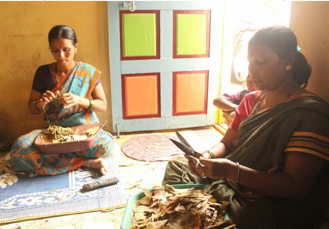
Subin Dennis/Institut Tricontinental de Recherche Sociale

*Traduit par Jacques Boutard, édité par Fausto Giudice, Tlaxcala