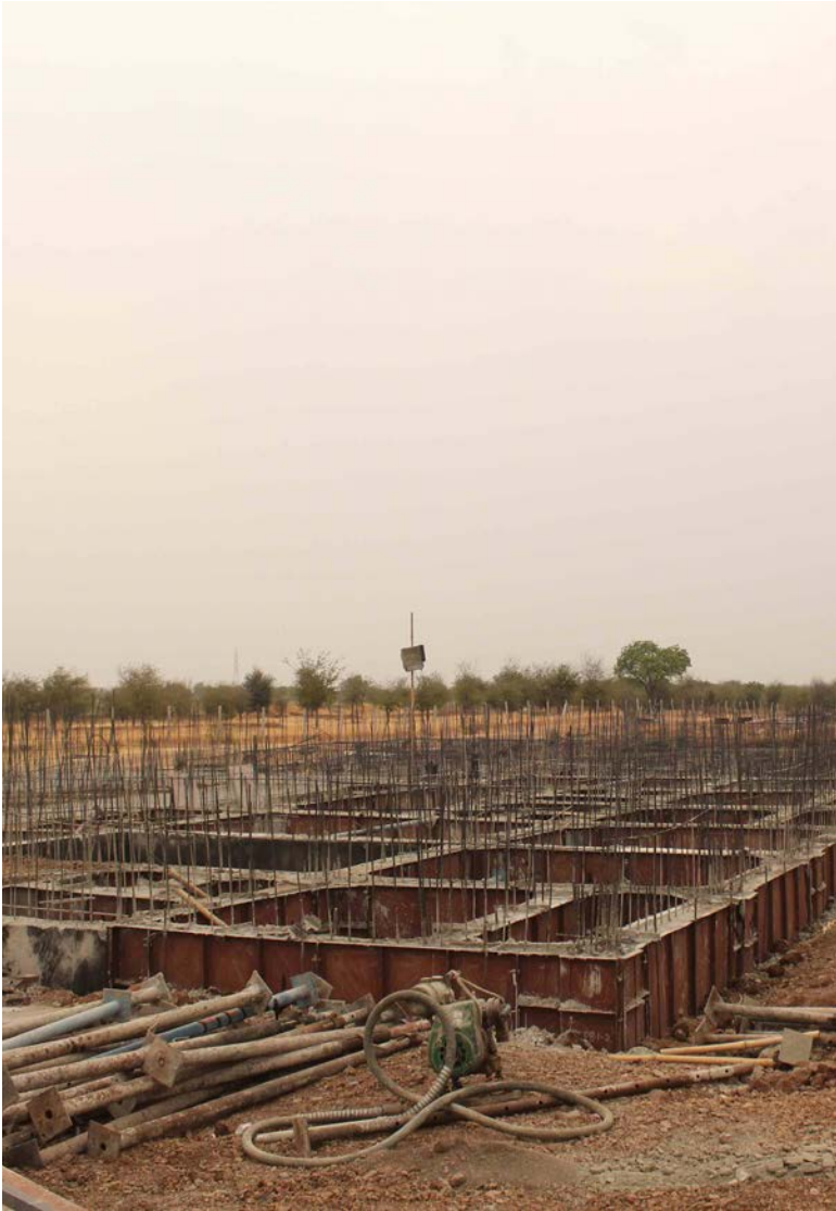
Subin Dennis/Institut Tricontinental de Recherche Sociale