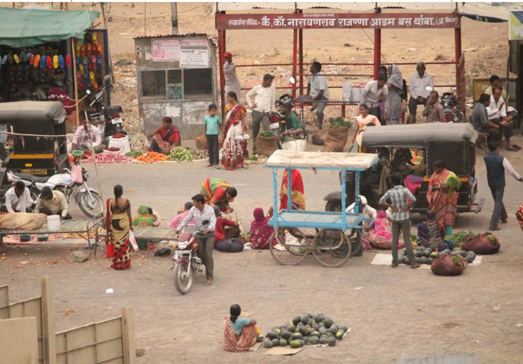
Subin Dennis/Institut Tricontinental de Recherche Sociale