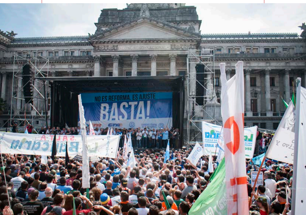
Bárbara Leiva/Patria Grande