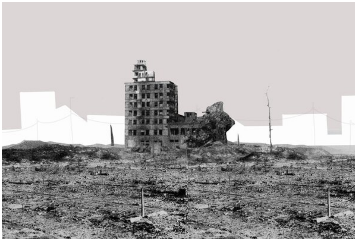
Здание Шигоку Шимбун, 10 августа 1945. Satsuo Nakata / Сатцуо Наката.

Четыре дня спустя, Сатцуо Наката прибыл в город с камерой Leica в качестве репортёра Domei New Agency. Он сделал тридцать две фотографии этого опустошения, каждая из этих фотографий, вошла в архив Мемориального музея мира в Хиросиме и приобрела статус иконы. Ударная сила бомбы, даже беря в расчёт что меньше 2% урана детонировало, сравняла город с землёй. Наката сделал снимок офисного здания газеты Шигоку Шимбун и магазина кимоно Одамаса. Железная конструкция магазина скрутилась в форму воронки — доказательство силы этого оружия. Как писал Тогэ Санкити, хibaкуся (жертва ядерного взрыва) и поэт, о силе и последствиях взрыва, после того как пожар взрыва угас в городе с 350 000 населением, “единственным звуком были крылья мух, жужжащих среди металлических обломков”.