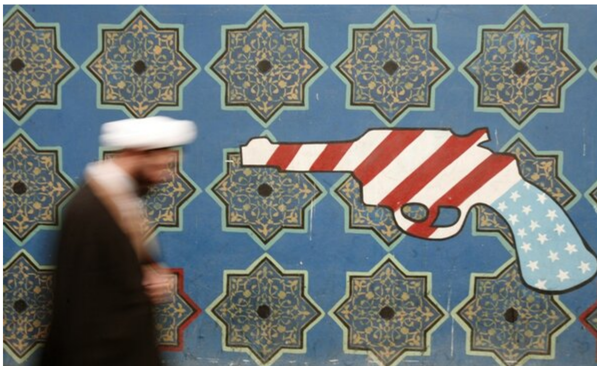
Иранский священнослужитель проходит мимо фрески на стене бывшего посольства США. Тегеран, Февраль 2007.

Ежегодник СИИПМ отмечает что Иран, у которого нет ядерного оружия и который не выражал желание его иметь, продолжил соблюдать Совместный всеобъемлющий план действий 2015 (СВПД) (Joint Comprehensive Plan of Action, JCPOA). СВПД также известный, как Иранское ядерное соглашение, был согласован Ираном и пятью членами Совета безопасности ООН (Китай, Франция, Россия, Великобритания и Соединенные Штаты), а также Германией и Европейским Союзом и затем ратифицировано ООН. В мае, Соединенные Штаты вышли из этого договора, который накладывал ограничения на иранскую ядерную программу. Выход США из соглашения дестабилизировал весь регион, на что Бюллетень учёных-атомщиков заявила, что этот односторонний выход США из Иранского соглашения и выход из ДРСМД являются “опасными шагами в направлении полного прекращения глобального процесса контроля над вооружениями”.