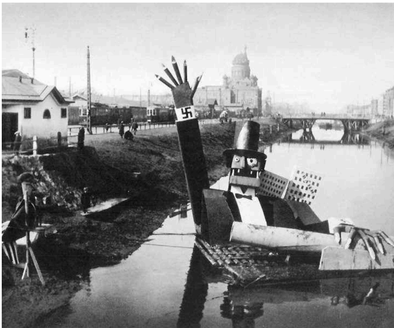
Instalação de arte antifascista, no 1º de maio, no Canal Obvodny, Leningrado, USSR, 1932

O romance de Tolstói não conseguiu resolver o problema de Maslova. Mas trouxe a desumanidade à superfície. Isto é, em termos gerais, o propósito da arte. Esta não muda o mundo por si só. Ler um romance ou observar um design pode chamar nossa atenção para os problemas e até mesmo fornecer uma compreensão deles. Mas não pode por si só mudar o mundo. A arte e a literatura nos alertam para as contradições, mostram como essas contradições - como a prisão de Maslova - não podem ser superadas por sentimentos bons e liberais. Lutas são necessárias. Nekhlyudov sabe disso. As prisões defendem “interesses de classe”, diz ele, referindo-se aos interesses da aristocracia e dos industriais. Os interesses de outras classes - os trabalhadores, como Maslova - foram suprimidos. A arte revelou a