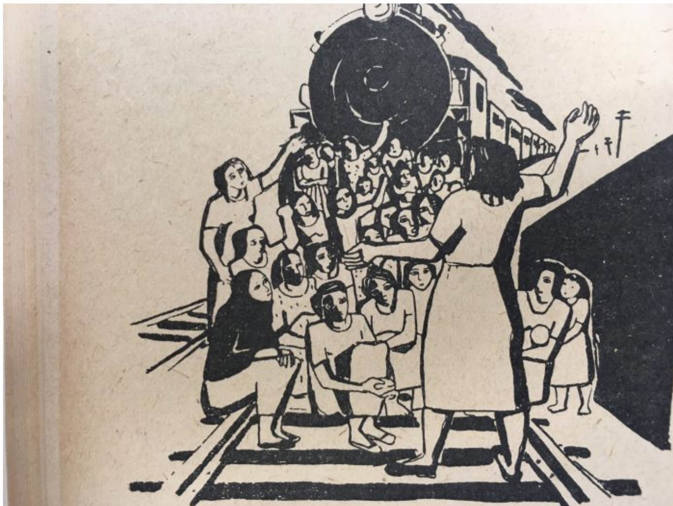
Federação de Mulheres Brasileiras, xilogravura, década de 1950

supressão. A luta levaria essa revelação para além.